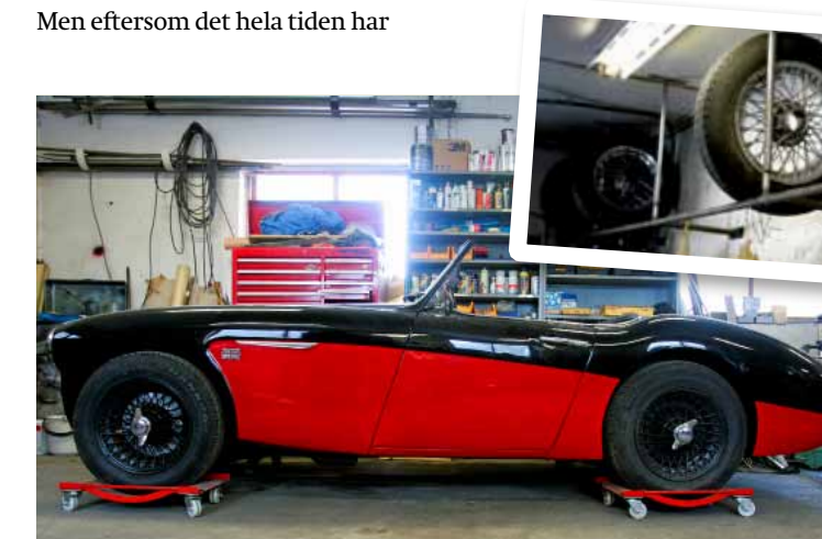
Med extra kraftiga ekerhjul och bitigare däck ökar vägkänslan högst dramatiskt. Svarta fälgar är grymt snyggt på en Healey.