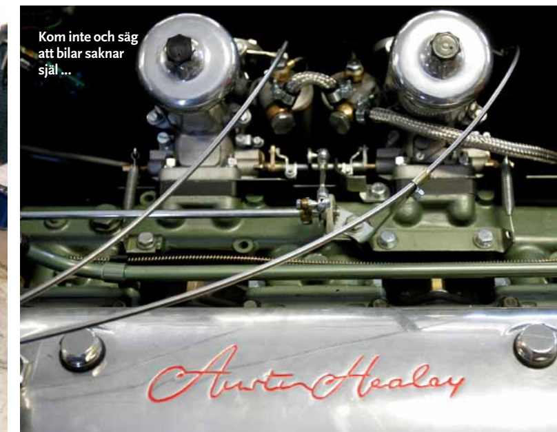
Kom inte och säg att bilar saknar själ...

– När sommaren närmar sig blir man gärna sju år gammal igen,